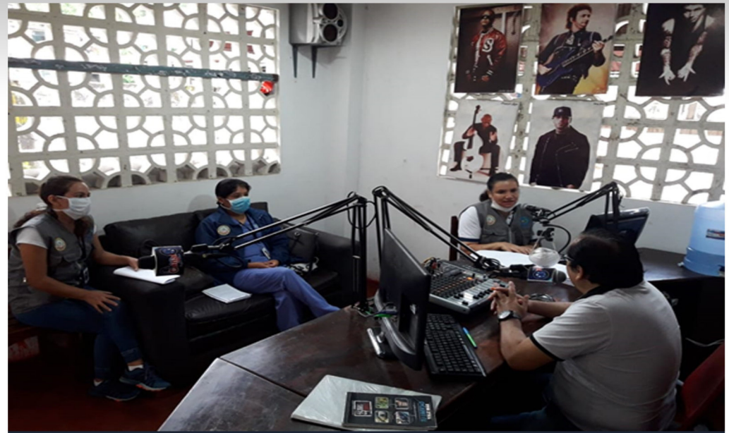
PARTICIPACIÓN EN MEDIOS DE COMUNICACIÓN